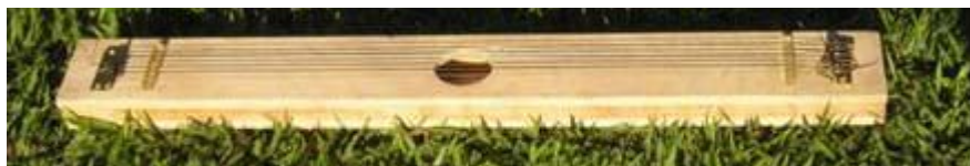
Figura 1 – Harpa eólica.