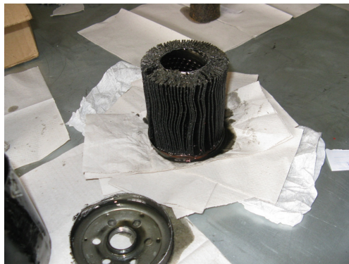
Figura 3: filtro de combustível contaminado por óleo lubrificante

Verificou-se engripamento dos anéis de vedação dos pistões, provavelmente, relacionado à má lubrificação no local em função da contaminação do óleo lubrificante. Esta contaminação ficou evidente através da observação do filtro de combustível, conforme mostra a figura 3.