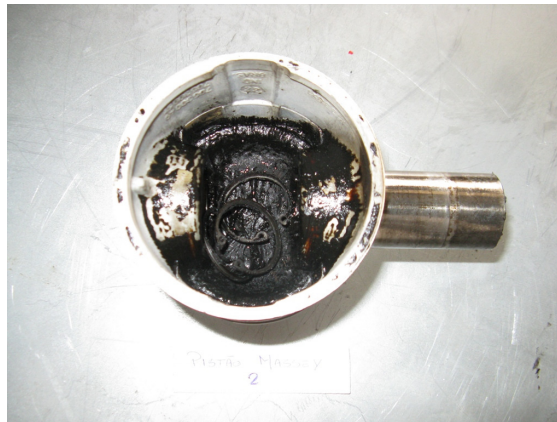
Figura 2: Presença de material altamente viscoso na parte inferior do pistão

Ao término dos ensaios, um dos tratores Massey Ferguson apresentou presença de materiais sólidos no carter do motor, o que já havia sido identificado com 100h de uso do combustível, à pedido do proprietário. Como consequência, este material sólido foi transportado pelas galerias internas do motor, o que reduziu a capacidade de lubrificação do óleo. Também foi evidenciada uma grande contaminação do motor por uma espécie de borra escura de alta viscosidade na parte inferior dos pistões e no comando de válvulas, conforme ilustra a figura 2.