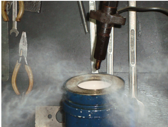
Figura 4: ensaio em bancada para verificação da injeção de combustível

Também ao término dos ensaios, os bicos de injeção dos três tratores foram montados em uma bancada de testes e submetidos a uma pressão de 180bar, com diesel e biodiesel, para verificar sua estanqueidade e a distribuição do jato do combustível, não tendo sido observado nenhum problema nos três bicos injetores. A figura 4 ilustra este teste.