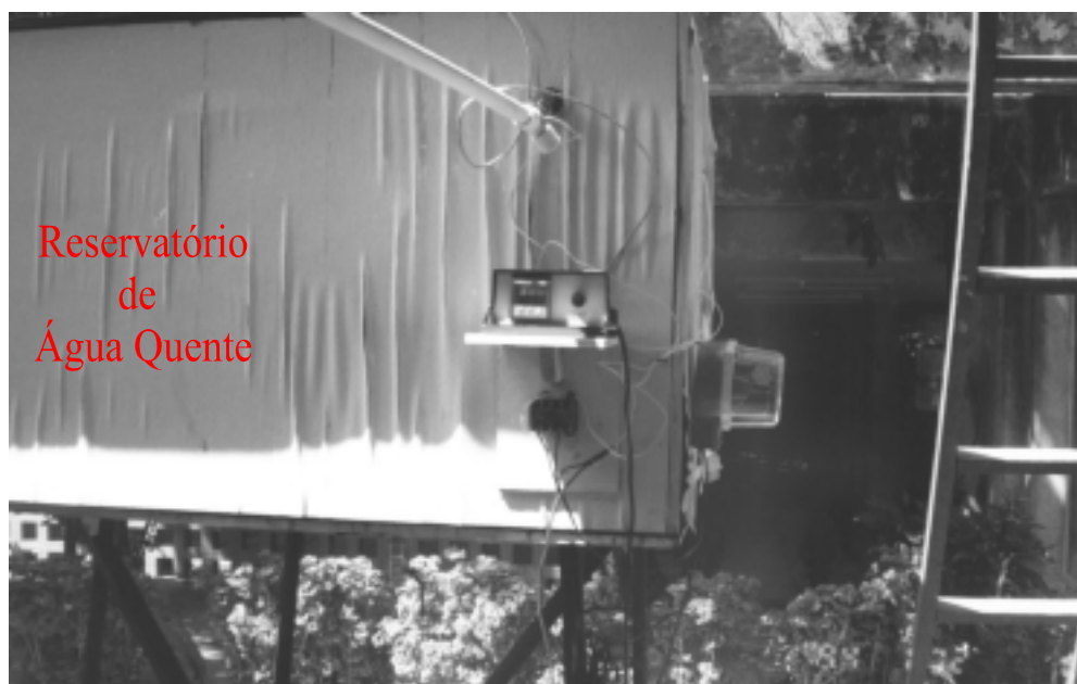
Figura 2 - Reservatório de água quente do sistema de aquecimento